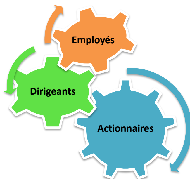
Figure 1.3 : Les acteurs de l'entreprise